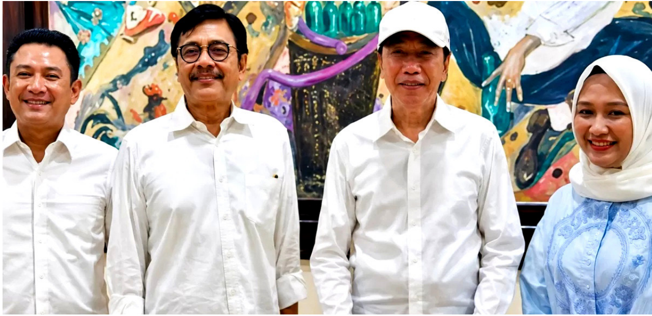
Mantan Gubernur Sulawesi Tenggara Nur Alam bertemu Jokowi di Solo