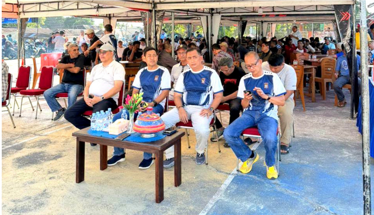
Turnamen Domino Terbuka yang digelar Kepolisian Resor (Polres) Baubau dalam rangka memperingati Hari Ulang Tahun (HUT) Bhayangkara ke-80