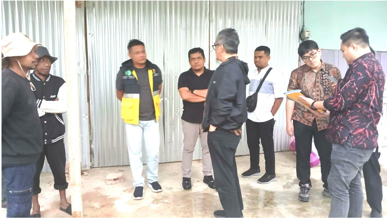
Komisi Pemberantasan Korupsi Republik Indonesia (KPK RI) memperketat pengawasan terhadap proyek pembangunan yang bersumber dari pokok-pokok pikiran (pokir) anggota DPRD di Sulawesi Tenggara.