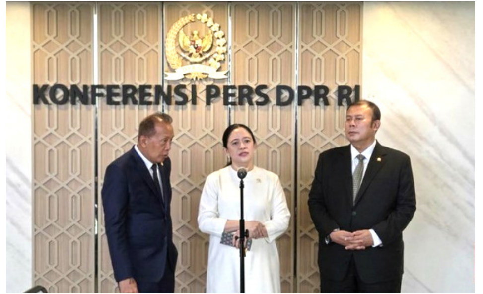
Ketua DPR Puan Maharani mengungkapkan empat RUU prioritas untuk masa sidang V