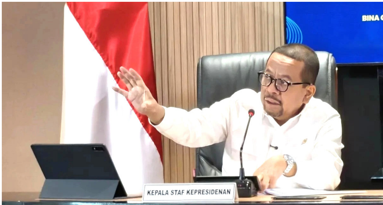
Kepala Badan Komunikasi Pemerintah (Bakom) RI Muhammad Qodari.