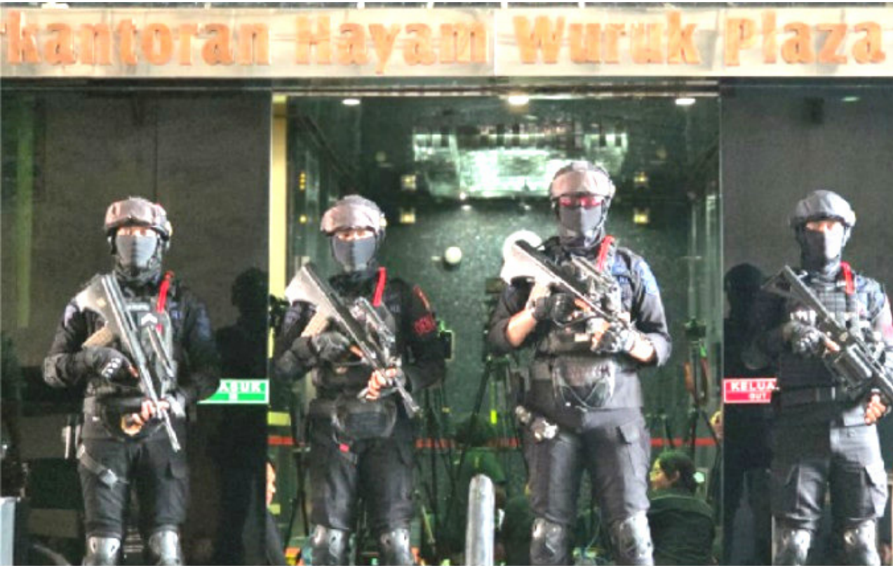
Polisi bakal memeriksa pemilik gedung yang disewa menjadi kantor operasional sindikat judi online transnasional di kawasan Jalan Hayam Wuruk, Jakarta Barat.