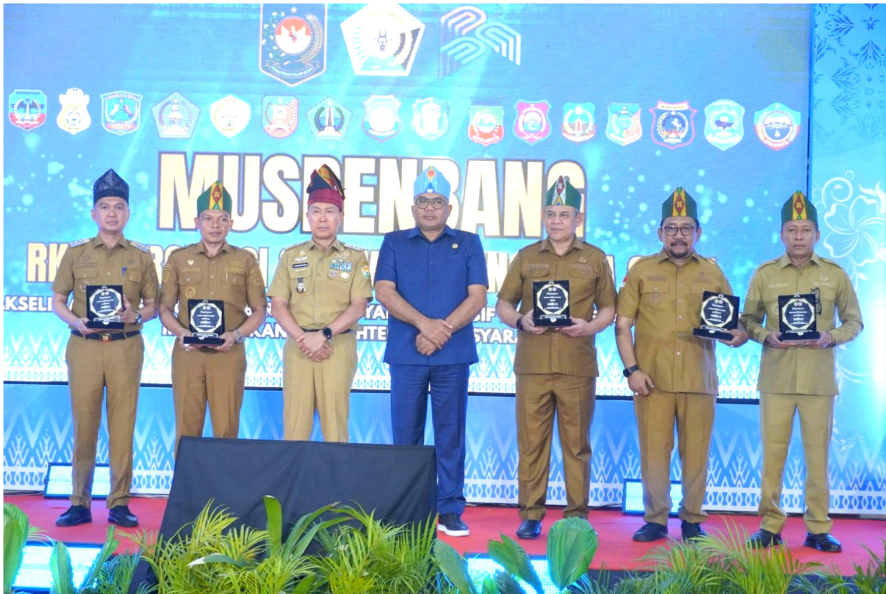
Pemerintah Kota Baubau kembali menorehkan capaian di tingkat Provinsi Sulawesi Tenggara setelah meraih penghargaan Terbaik III Kinerja Aksi Konvergensi Percepatan Penurunan Stunting tahun 2026