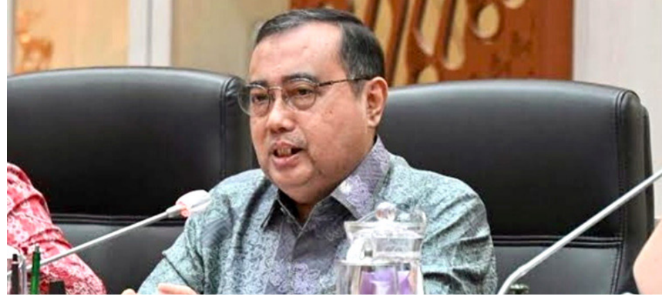
Hantavirus Ancam Dunia, DPR Minta RI Perkuat Pintu Masuk Negara Pemerintah RI Diminta Tingkatkan Skrining Hantavirus di Seluruh Perbatasan

JAKARTA -- Pemerintah diminta meningkatkan pengawasan di seluruh pintu masuk Indonesia menyusul munculnya kasus hantavirus di kapal pesiar MV Hondius yang menyebabkan tiga orang meninggal dunia. DPR menilai langkah antisipasi harus segera dilakukan untuk mencegah potensi masuknya virus berbahaya tersebut ke wilayah Indonesia melalui jalur internasional.