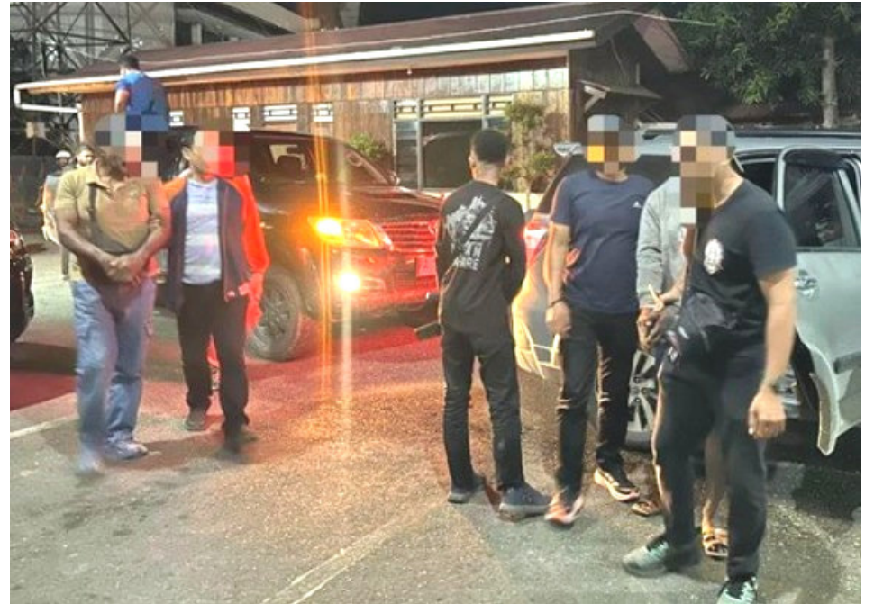
Satuan Tugas (Satgas) Operasi Damai Cartenz menangkap empat terduga penyuplai amunisi ilegal kepada Kelompok Kriminal Bersenjata (KKB) di wilayah Papua.