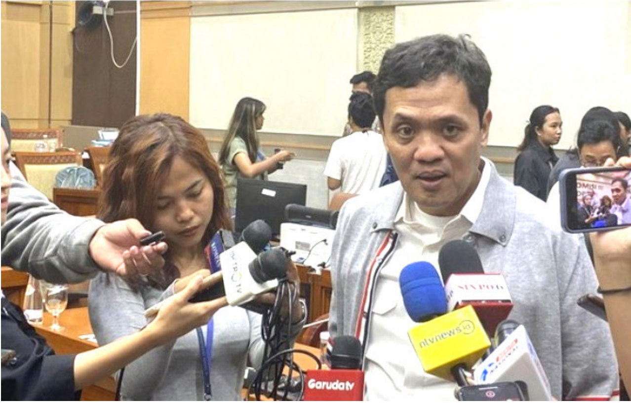
Ketua Komisi III, Habiburokhman.