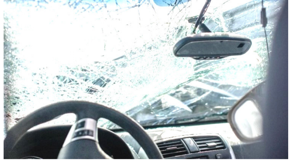
Ilustrasi. Pelajar tabrak warga pakai mobil dinas Pemda Mamuju.