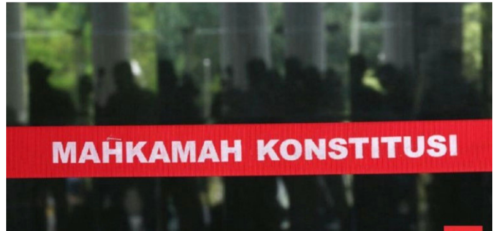
Ilustrasi. UU Pemilu Digugat, MK Diminta Larang Keluarga Presiden Maju Pilpres.